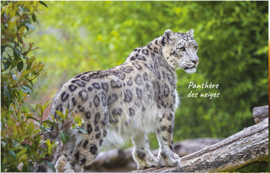
Panthère des neiges