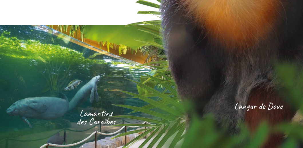
Lamantins des Caraïbes