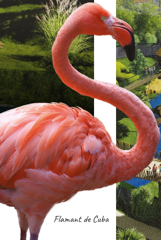
Flamant de Cuba