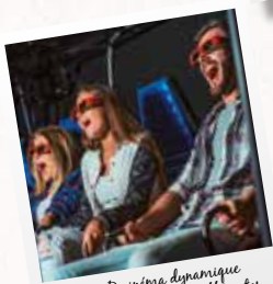
7D cinéma dynamique avec 2 projections différentes