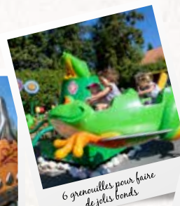
6 grenouilles pour faire de jolis bonds