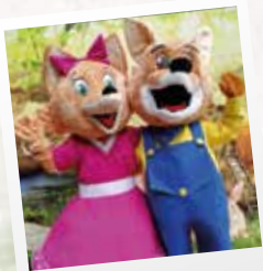
Roxy et Angy

Pour finir sa journée, on se fait plaisir dans la boutique d'Angy par un souvenir du parc, pourquoi pas une peluche, une médaille souvenir, un mug ou un aimant. Nos mascottes Angy et Roxy sont fières d'y figurer !