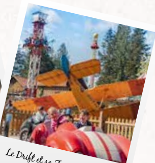
Le Drift et sa Tour de contrôle

Pour toute la famille ou entre amis, venez découvrir les attractions.