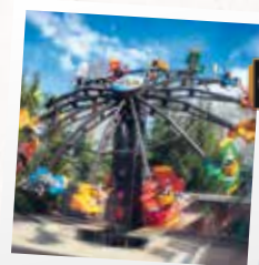
Record 71 vrilles en 2,35 minutes

Vous recherchez le frisson alors montez à bord de « Flash Tower » une tour de 40 mètres de haut ou du grand huit le « Tornado » avec ces wagonnets virevoltants et dévalez les pentes sur 420 mètres de rails ! A moins que vous préfèrez tourner dans le manège exceptionnel la « Déferlante » ou faire des vrilles à bord de « l'Escadrille ».