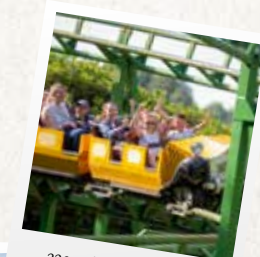
220 mètres de course folle !