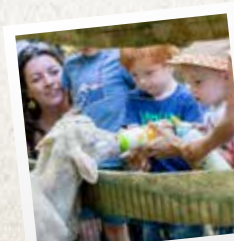
La ferme d'Angy

Dans les bois, vous recherchez la douceur, chevauchez « Les Poneys » ou donnez le biberon aux animaux de la « Ferme d'Angy ». Les petits aventuriers feront un tour de « Cochons qui rient » ou de « Ferme foldingue ».