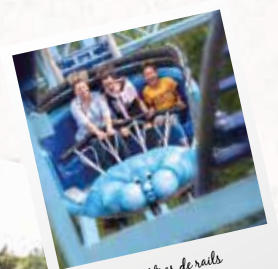
420 mètres de rails