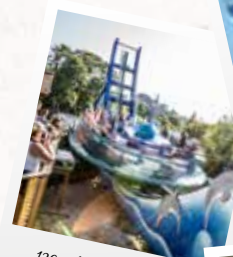
120 pulsations à la minute

Muni de votre casque et de votre laser, vous vivez ici une expérience différente en plein cœur des bois !