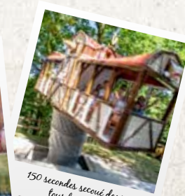
150 secondes secouré dans tous les sens