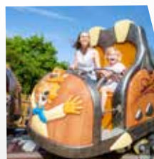
360 degrés de rotation

Levez les bras et c'est parti pour un tour de « Tourbillon », changez d'embarcation et vous voilà en moto dans les « Sidecars volants ». A moins que ce soit le « Cinéma dynamique » avec vos lunettes 3D et tous les effets de cette machine folle, on s'y croirait !