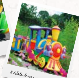
8 éclats de rire en 60 secondes