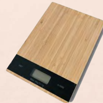
ACC5821 Balance de cuisine en bambou

Retrouvez notre gamme complète sur notre site internet ou sur demande : www.lafabriquecadeaux.com