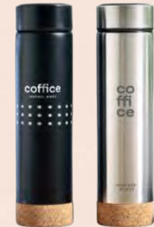
Marquage sur l'objet