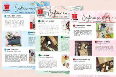
Plaquette de choix Les salariés choisissent leur préférence