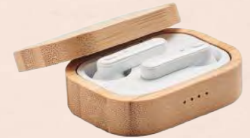
MO6780-40 Lot de 2 oreillettes True Wireless Stereo 5.0 dans un étui bambou avec batterie 30 mAh intégrée