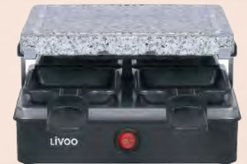
ACC6300 Appareil à raclette pierre à grill 4P plateau en granite amovible