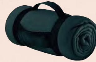
ACC5173 Couverture polaire plaid avec poignée