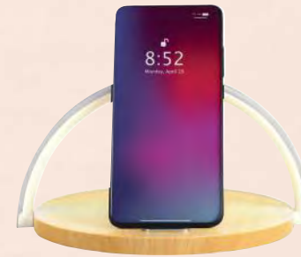
ACC6299 Lampe de chevet tactile 2 en 1 station de chargement sans fil par induction