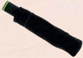
ACC5824 Parapluie noir compact