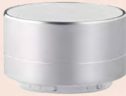
ACC6141 Haut-parleur sans fil 4.2 en aluminium avec batterie rechargeable