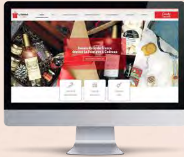
Nouveau site internet dédié aux CSE www.lafabriqueacadeaux.com