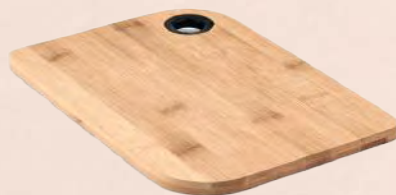
ACC6143 Planche à découper en bambou 24.5 cm