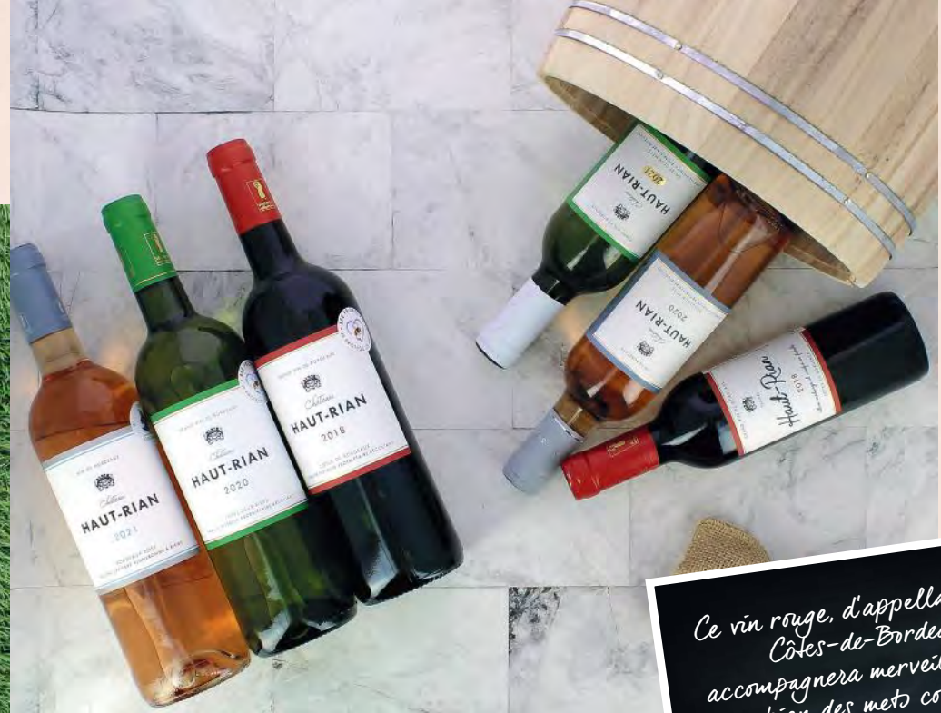
Collection Chateau Haut Rian - AOP Côtes de Bordeaux 75 cl et 37.5 cl En rouge, blanc minéral et rosé.

Ce vin rouge, d'appellation AOP Côtes-de-Bordeaux, accompagnera merveilleusement bien des mets comme : la volaille, le porc, le bœuf, le gibier, le veau et les fromages forts.