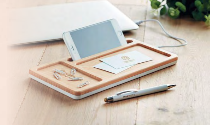
MO9666-06 Bloc de chargement sans fil avec compartiments, hub USB et support smartphone