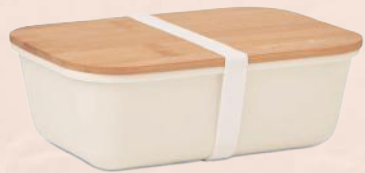
ACC6403 Boîte à lunch beige en PP et couvercle en bambou