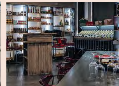
Rencontre avec nos équipes RDV show-room et aux salons CSE