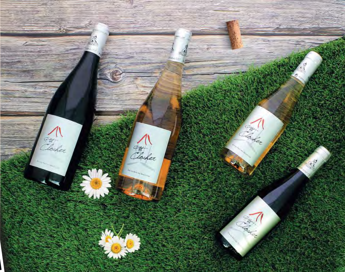
Collection P'tit Clocher - IGP Vacluse 75 cl En rouge, blanc minéral et rosé.