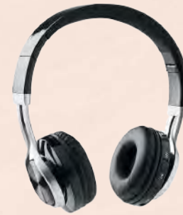
ACC5406 Casque audio sans fil 5.0 ABS avec batterie rechargeable