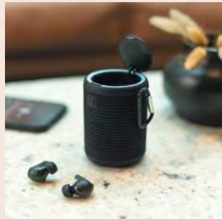
Une idée cadeau en tête ? Nous mettons tout en oeuvre pour trouver l'objet de votre choix