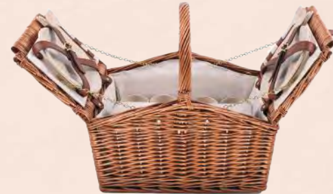
EMB5851 Panier en osier pique-nique avec plaid polaire et 4 couverts