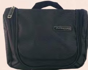
EMB3449 Trousse de toilette KAPPA