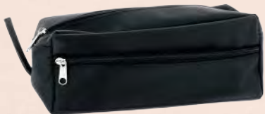
ACC5825 Trousse de toilette noire