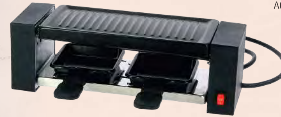
ACC5682 Appareil à raclette avec grill 2P