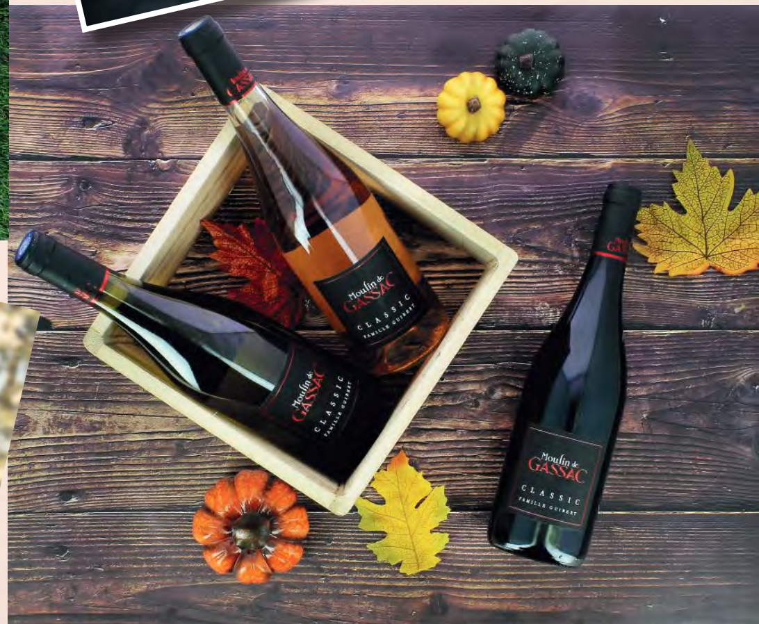
Collection Moulin de Gassac - IGP L'Hérault classic 75 cl En rouge, blanc minéral et rosé.

Ce vin rosé, d'appellation IGP Pays d'Hérault, sera parfait pour accompagner votre apéritif, des grillades au barbecue (courgettes, aubergines, côtes d'agneaux) ou encore vos fromages frais.