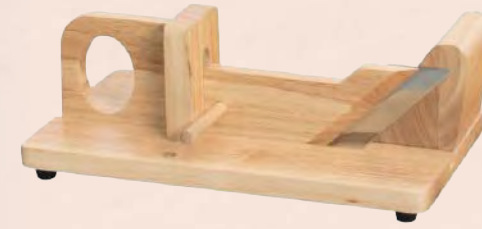
ACC4496 Guillotine à saucisson en bois