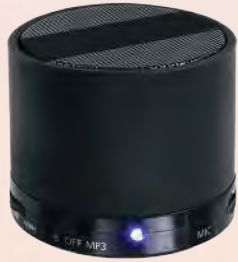
ACC4494 Haut-parleur sans fil 4.2 en ABS, batterie rechargeable