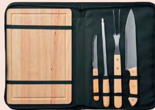
ACC5996 Kit d'accessoires pour barbecue + planche à découper