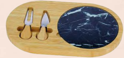
ACC5681 Planche à fromage en bambou avec couverts