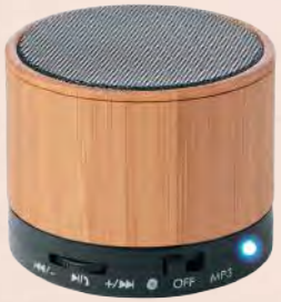
MO9608-06 Enceinte en bambou sans fil 4.2 en ABS, batterie rechargeable