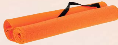
ACC4615 Paillasse de plage orange