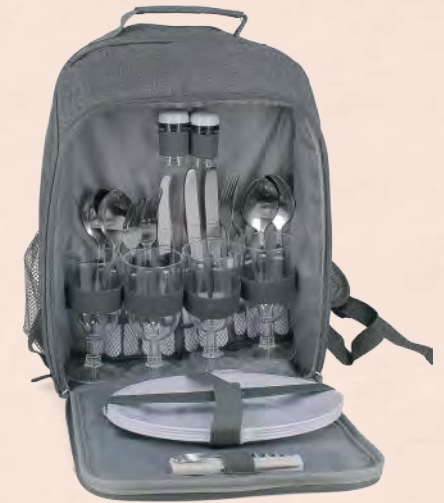
EMB5166 - Sac à dos isotherme pique-nique 4 couverts