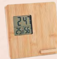
ACC6505 Station 2 en 1, météo avec affichage de l'heure et de la température et chargeur smartphone sans fil 10W