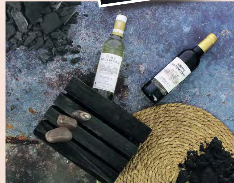
Collection demi-bouteilles AOP Bordeaux 37.5 cl Blanc moelleux et rouge

Ce vin rouge, d'appellation AOP Côtes-de-Bordeaux, accompagnera merveilleusement bien des mets comme : la volaille, le porc, le bœuf, le gibier, le veau et les fromages forts.