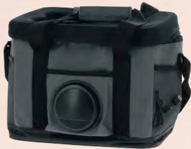
EMB5109 Glacière isotherme haut-parleur 35 x 30 x 23.50 cm