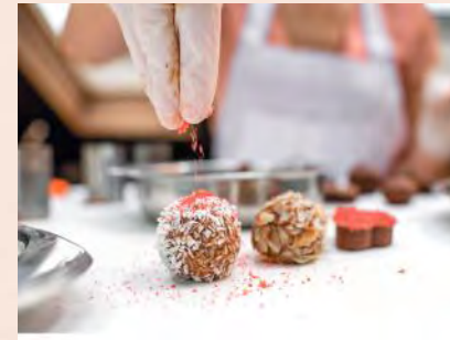
Partenaires locaux Produits artisanaux de qualité