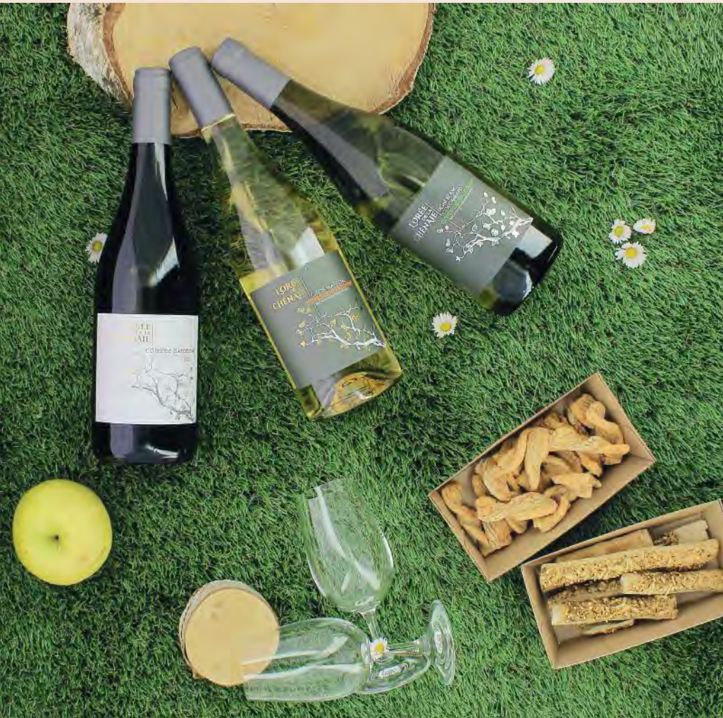
Collection Orée de la Chesnaie - IGP Côtes de Gascogne 75 cl En rouge, blanc minéral et blanc moelleux.